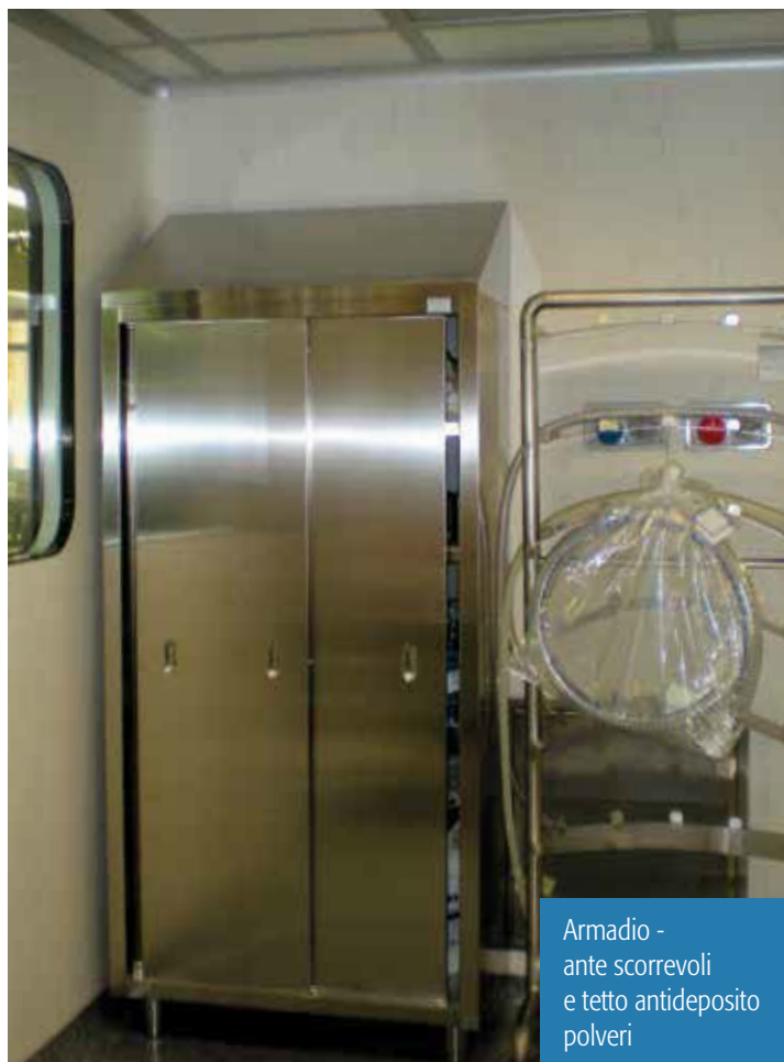
Armadio - ante scorrevoli e tetto antideposito polveri