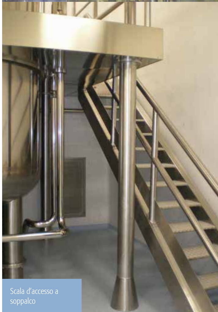
Scala d'accesso a soppalco