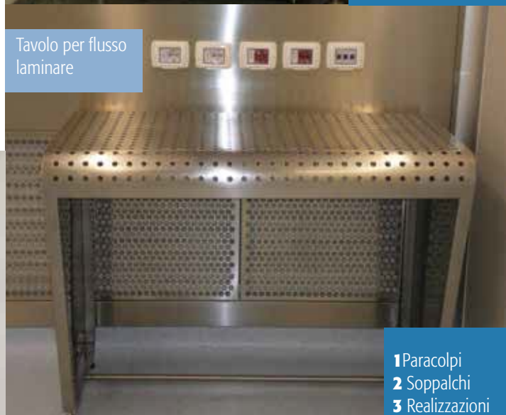
Tavolo per flusso laminare