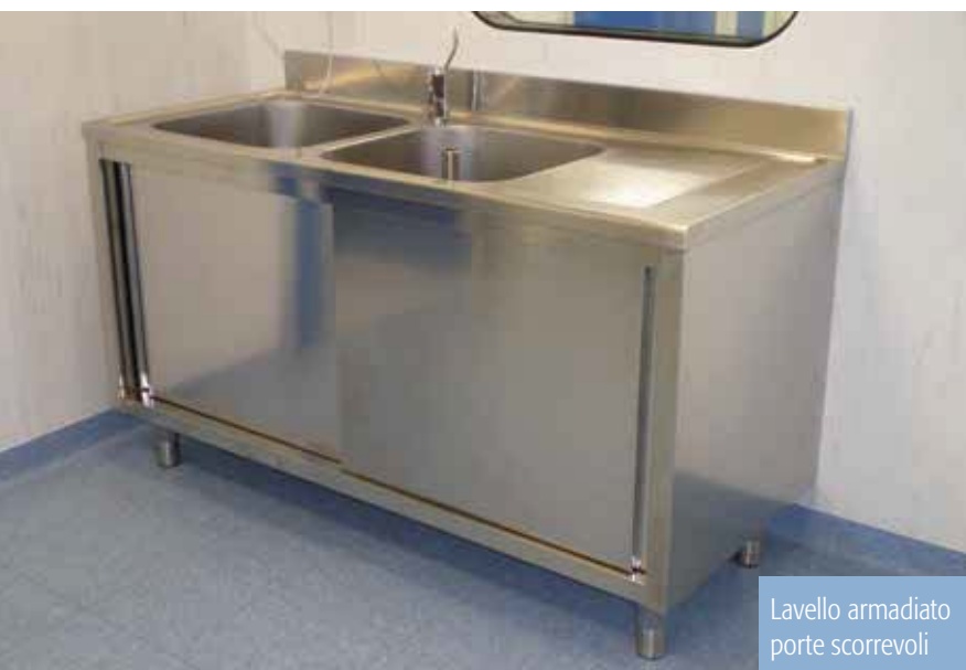
Lavello armadiato porte scorrevoli

(I dati tecnici relativi alla scheda possono variare senza preavviso)